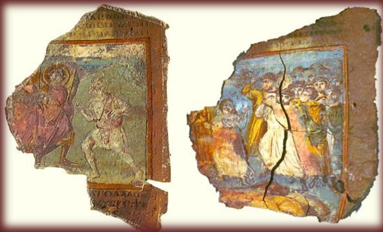
... Дом Лота. Фрагменты миниатюр из Книги Бытия Котона. VI в...

И, наконец, космический Адам, безвозвратно отдав всего себя Богу, передал бы Ему все Его творение и получил бы от Него по взаимности любви – по благодати – все, чем Бог обладает по природе; так, в преодолении первичного разделения на тварное и нетварное совершилось бы обожение человека и через него – всего космоса.».